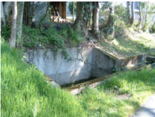
Fontaine du Mas

Nous attendons la réponse du Conseil Général.