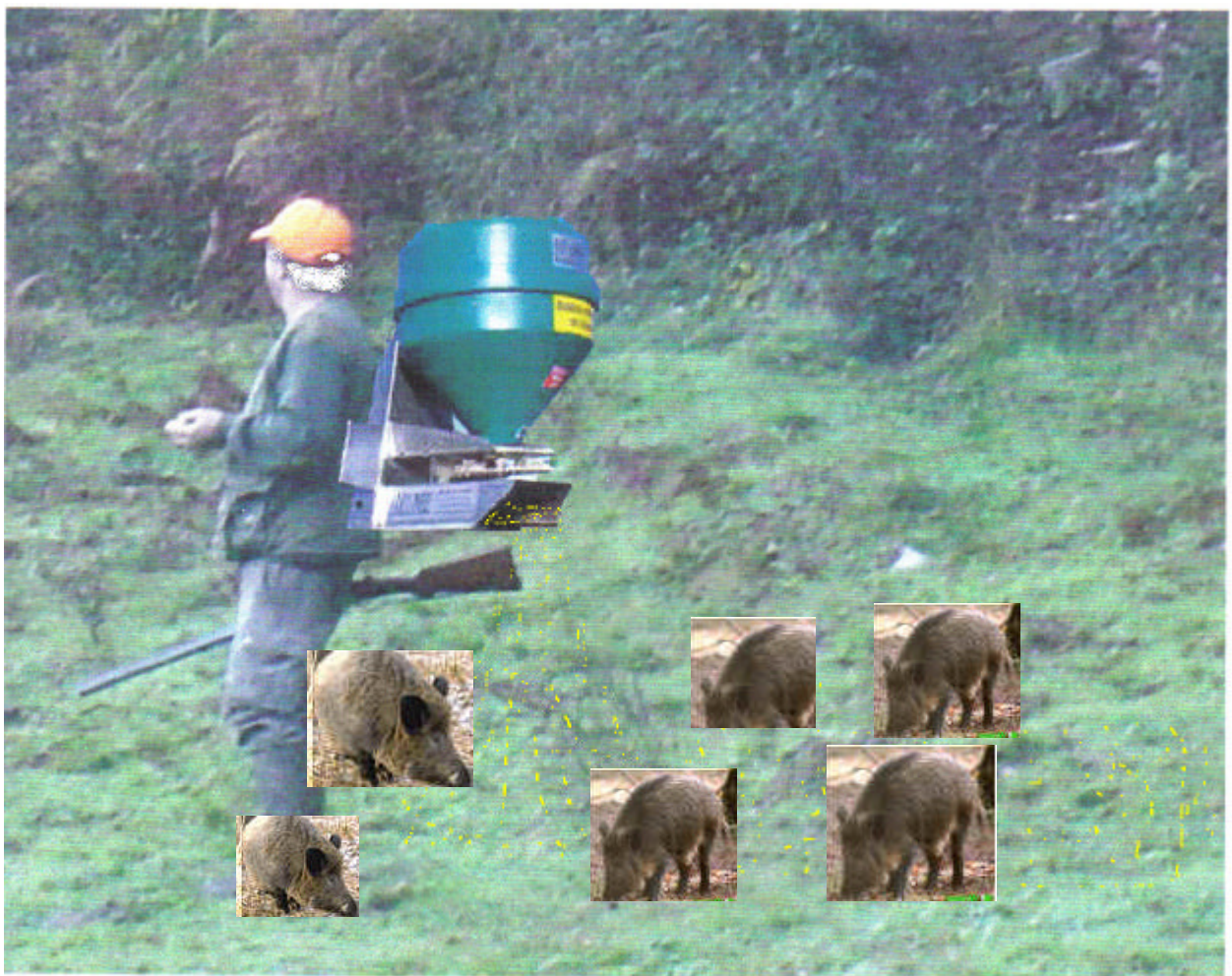
Agrainage ou égrainage .....les sangliers apprécient.