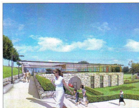
Vue depuis l'entrée de l'Espace Ventadour : le volume principal aux façades de verre correspond aux bassins et à l'espace d'accueil placé en surplomb.