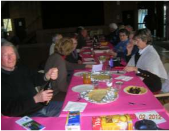
Après midi crêpes

Le 26 février a eu lieu notre loto annuel. Ce fut un succès. Nous remercions tous les participants à la réussite de cette journée.