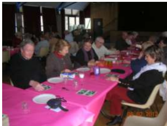
Après midi crêpes

L'après midi s'est terminé par la dégustation de la galette des rois.