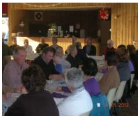
Assemblée Générale 2012

Les projets pour 2012 sont les suivants : après midi crêpes le 09 février, loto le 26 février, Théâtre le 5 mai, voyage à Versailles, participation à la fête du 15 août, thé dansant le 23 septembre, repas de Noël le 8 décembre Un voyage d'une journée à l'automne (date et lieu à définir).