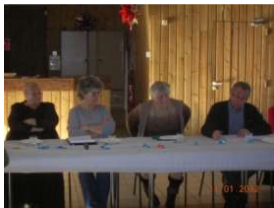
Assemblée Générale 2012